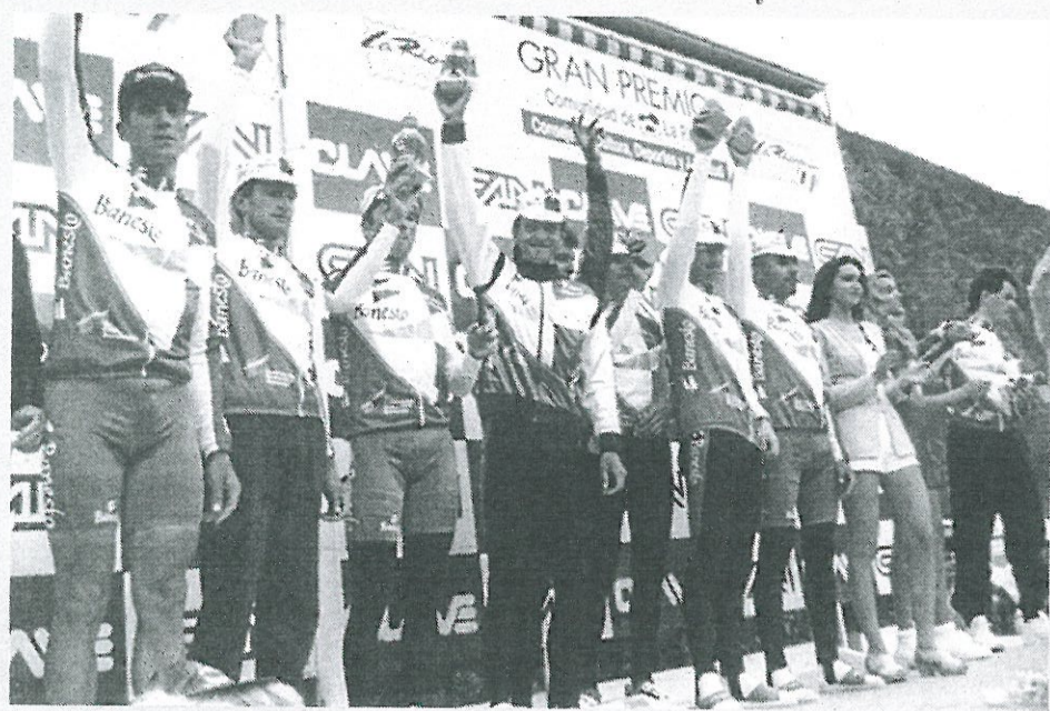
▲ Miguel Indurain, primero por la izquierda, en el podio con el equipo Banesto el año que ganó la Vuelta a La Rioja (1995).